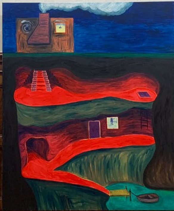
Ausstellungsansicht Kunsthhaus Langenthal: A little Row Boat, Öl auf Leinwand, 180 × 150cm, 2023

Cantonale Berne Jura Kunsthhaus Langenthal Langenthal, 2023