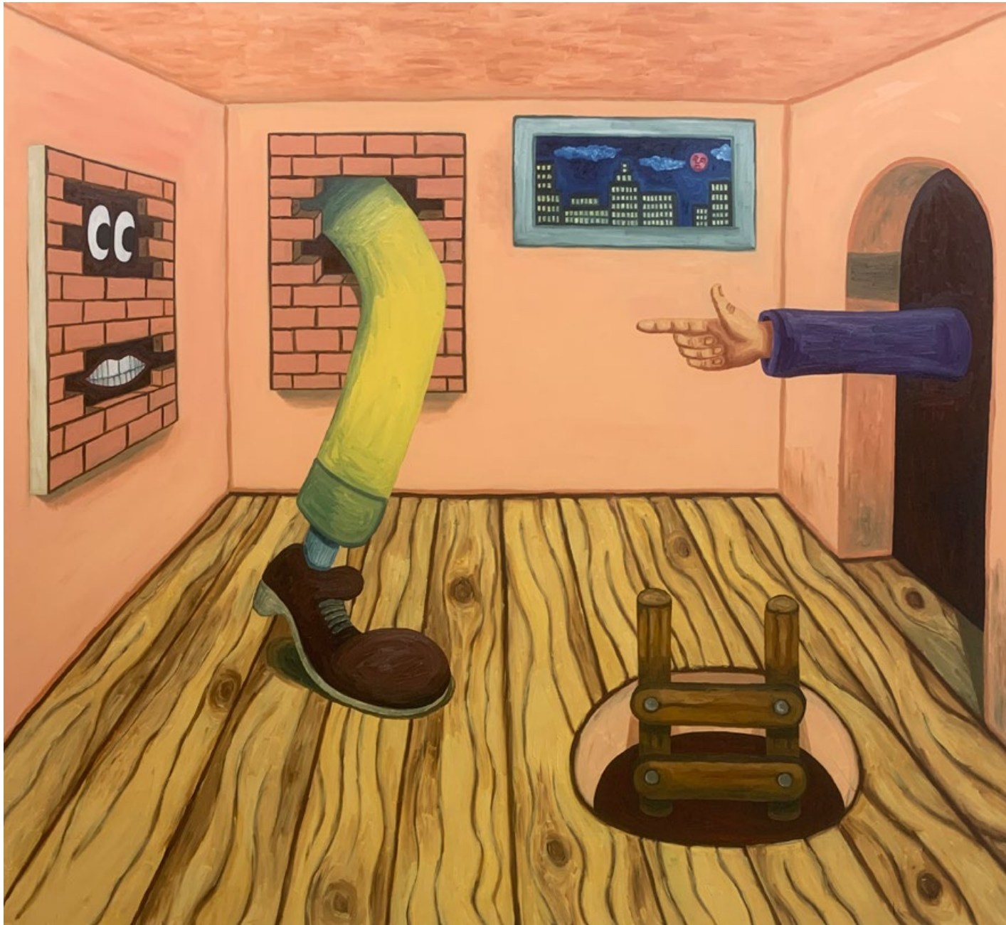
Quadri tra di loro (Da! Da!), Öl auf Leinwand, 180 × 200cm, 2025