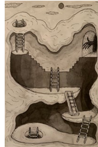
Ausstellungsansicht Ausstellungsraum Klingental: Von links nach rechts: Ohne Titel (L'ingresso del quadro), Ohne Titel (Quadri tra di loro), Ohne Titel (Monte Verità), Ohne Titel (Self-portrait as a bat 2), Ohne Titel (Self-portrait as a mountain with two holes and a few ladders), jeweils Tusche auf Papier, 29,7 × 21 cm, 2024