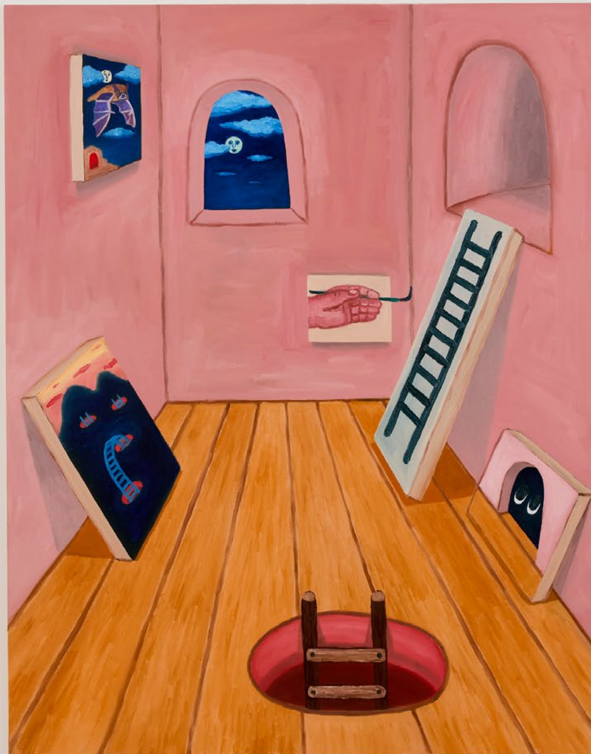
Ausstellungsansicht Gallery Ann Mazzotti: Quadri tra di loro, Öl auf Leinwand, 140 × 110 cm, 2024